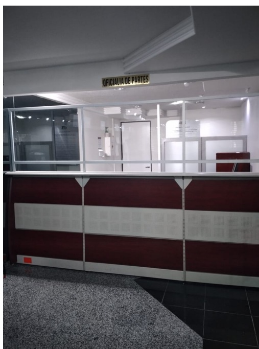
Oficialía de Partes