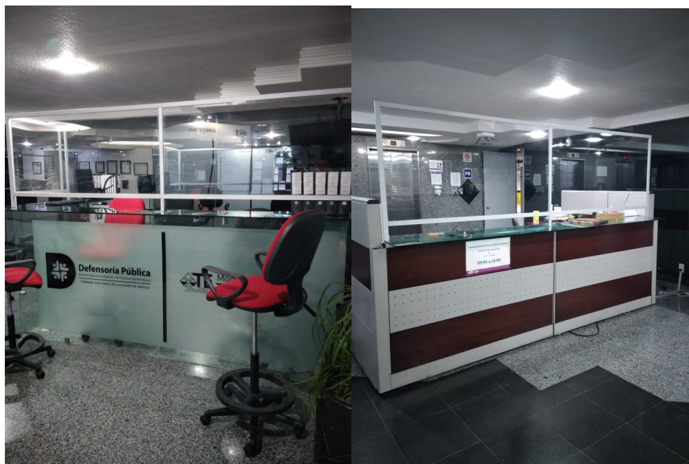
Defensoría y Transparencia